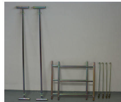
composizione del piano ponteggio da mt 1,00