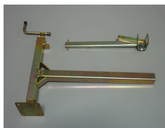
livellatore a piastra con puntone