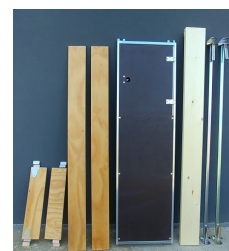
piano di lavoro completo, a norma