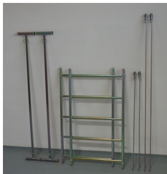
composizione del piano ponteggio da mt 1,50