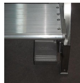
Particolare pedale kit dispositivo.

E' realizzata con telaio in acciaio inox, gradini e pianerottolo in alluminio antiscivolo. Sono previste 2 ruote fisse posteriori.