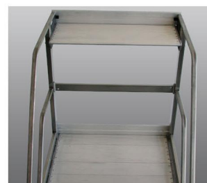
Particolare portaoggetti e pianerottolo.