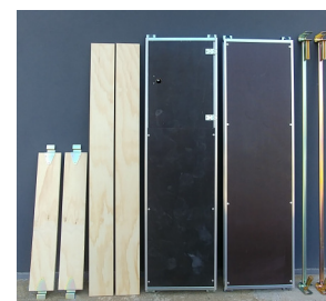
componenti del piano di lavoro