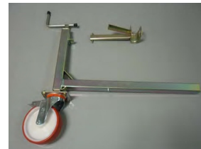
livellatore con ruota a freno e puntone