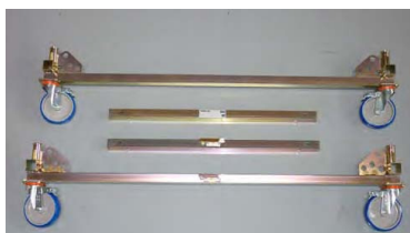
base completamente smontabile

Il ponteggio FZR è costruito in tubolare di ferro del diametro di mm 48 e trattato con zincatura elettrolitica a freddo, esente da cromo esavalente.