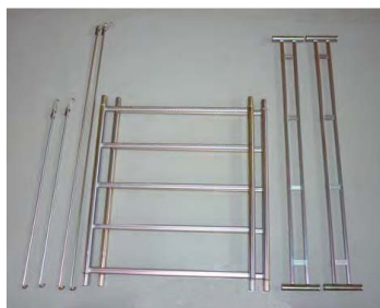
composizione del piano ponteggio da mt 1,50