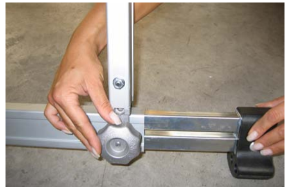
particolare della base aperta (utilizzo a libro)

Scala costruita con profilo di alluminio anodizzato mm 65 x 30 e gradini zigrinati antiscivolo mm 25x23 completamente avvitati.