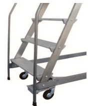
C versione 4500*P