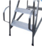
B versione 4500*M