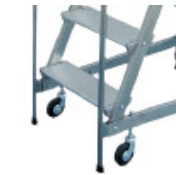
A versione 4500*