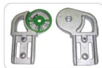
Cerniere in alluminio fuso e frizione interposta